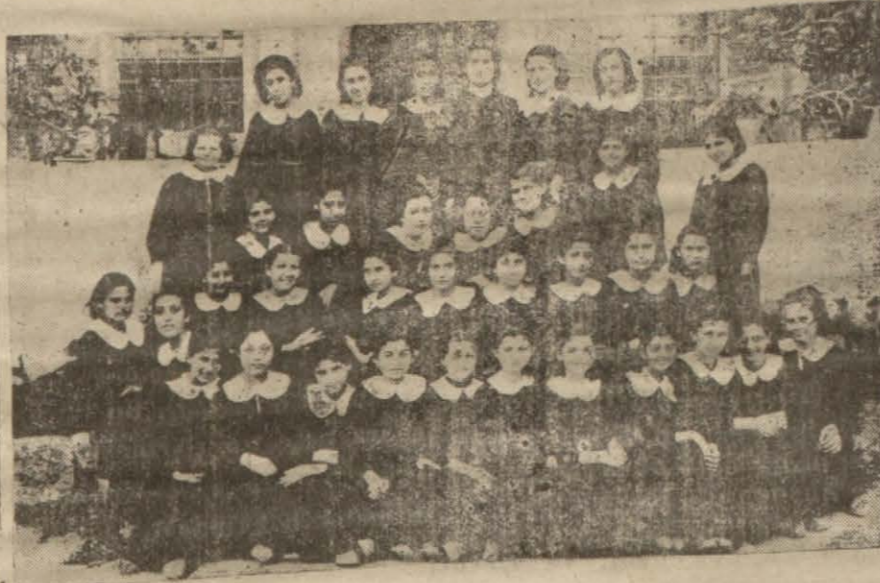
Kız talebelerimizden bir grup

Ankaradan bildirildiğine göre şehrimizde akşam kız sanat okulu açılmasına Maarif Vekâletince karar verilmiştir.